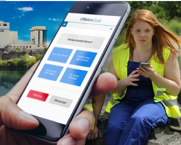
Selbstorganisiertes, flexibles Lernen – immer und überall

Das didaktische Konzept umfasst eine Verknüpfung von traditionellem Lernen wie Präsenzveranstaltungen und Printmedien sowie die Integration digitaler Lernmedien. Dabei werden aufbauend auf einer bereits etablierten Informations- und Qualifizierungsplattform der Zement- und Betonindustrie neue Lernmodule und Werkzeuge entwickelt und erprobt.